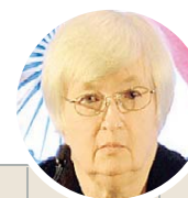
Presidenta Janet Yellen