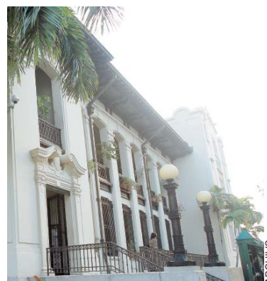
Sede del Tribunal federal de Quiebras en el Viejo San Juan.

De otro lado, el restaurante Vaca Brava del Viejo San Juan también radicó quiebra bajo el Capítulo II. Su