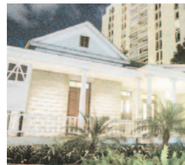
Sede del Colegio de Arquitectos y Arquitectos Paisajistas.

Ponencia para conocer las peculiaridades de las operaciones Puerto-Ciudad, así como la metodología para enfrentarse a proyectos de transformaciones urbanas. Comenzará a las 6:30 p.m. en el Salón