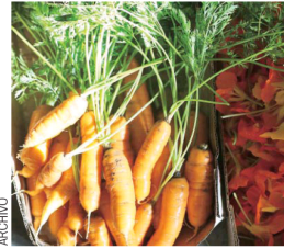
Las cenas serán confeccionadas por chefs profesionales.

“Es sumamente importante poder proveerles a nuestros comensales una experiencia de alta calidad desde los ingredientes locales, la confección del menú, hasta el servicio e interacción